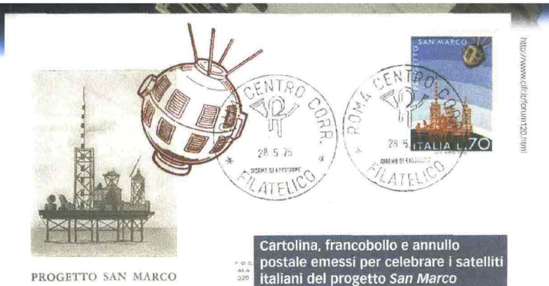
PROGETTO SAN MARCO

Ed è forse questa modalità , in cui la diffidenza politica e religiosa potrebbe aver spinto la scienza a chiudersi in se stessa, che ha radicato, nel grande pubblico, compreso quello degli operatori dei media (seppur con le dovute e apprezzabilissime eccezioni) una sorta di rifiuto della scienza. Sono storicamente limitati gli spazi dedicati all'informazione scientifica sia sui quotidiani che in TV, e quando ci sono, a riempirli sono spesso volgarizzazioni e sensazionalismi di «colore», o peggio di vero e proprio terrorismo. Anche quando di allarmismi non c'è né bisogno né motivo. D'altronde i media , o meglio, i loro editori, guardano spessissimo ai risultati di pubblico e quindi all'aspetto economico più che a quello di contribuire alla crescita culturale di un Paese. Con rare eccezioni: per esempio quello della TV pubblica nel dopoguerra, che ha fatto – questa volta davvero – oltre l'Italia, anche gli italiani, trasformando i dialetti in una lingua unica, combattendo l'analfabetismo endemico in una società ancora fortemente rurale. Ma questa stagione è durata poco: in Italia i mass media hanno via via perso la vocazione alla diffusione della cultura – anche scien-